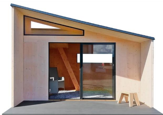
株式会社ビックボックス パネルハウスキット「B's CLT」